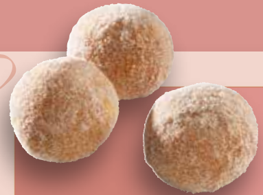
Mini Buttermilch Bällchen