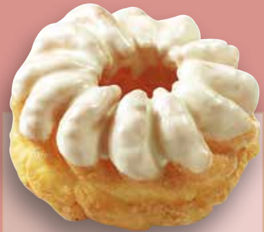
Spritzring mit Fondant