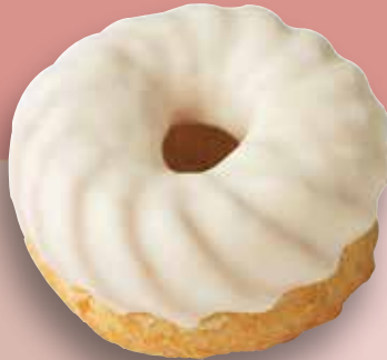
Spritzing mit heller Glasur