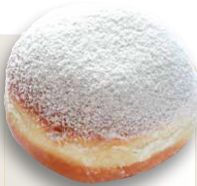
Berliner mit Füllung und Neuschnee