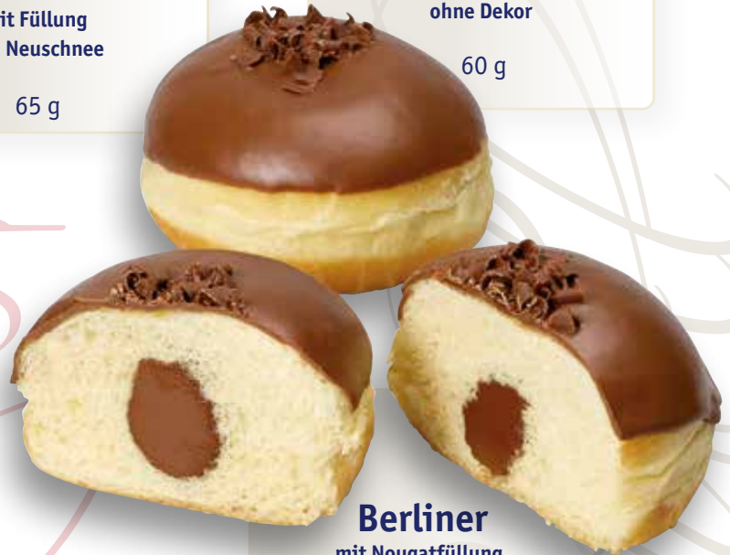
Berliner mit Nougatfüllung, Glasur und Schokolocken