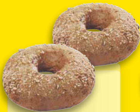
Mini Bagel malte multigraines