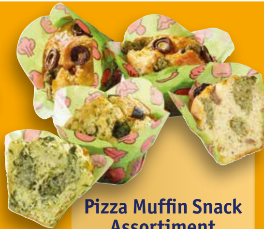
Pizza Muffin Snack Assortiment