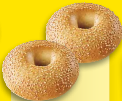
Mini Bagel sésame