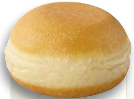
Beignet fourré nature