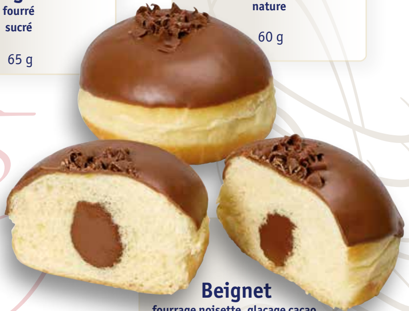
Beignet fourrage noisette, glaçage cacao, décor copeaux de chocolat